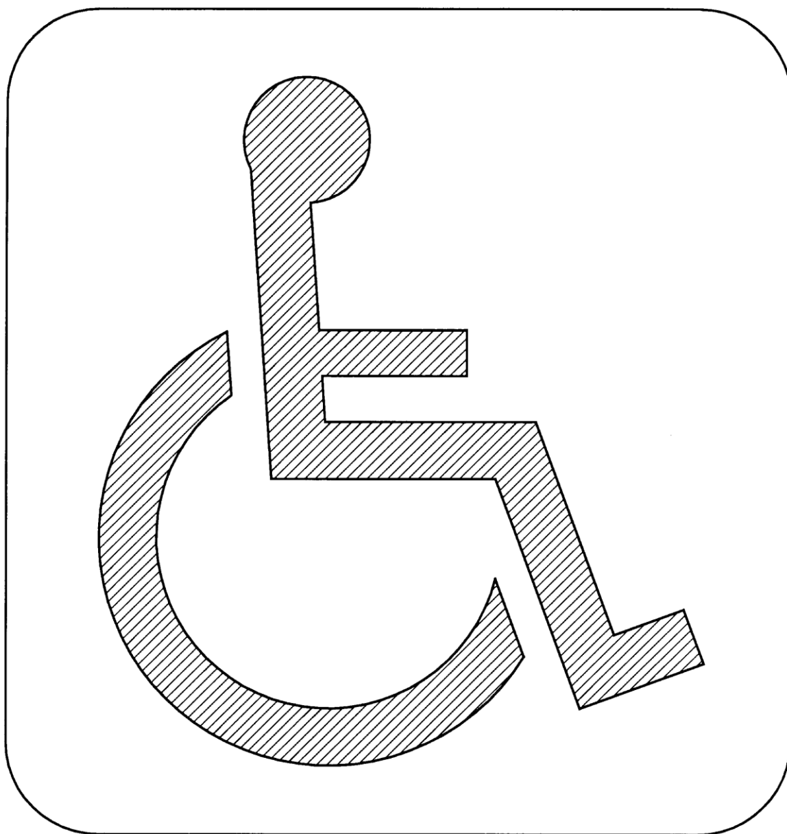
FIGURA 1. Símbolo de persona en silla de ruedas