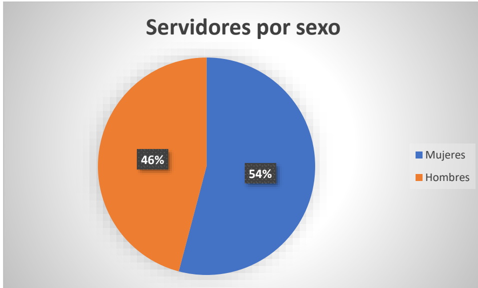
Gráfico 2 Distribución de servidores por sexo