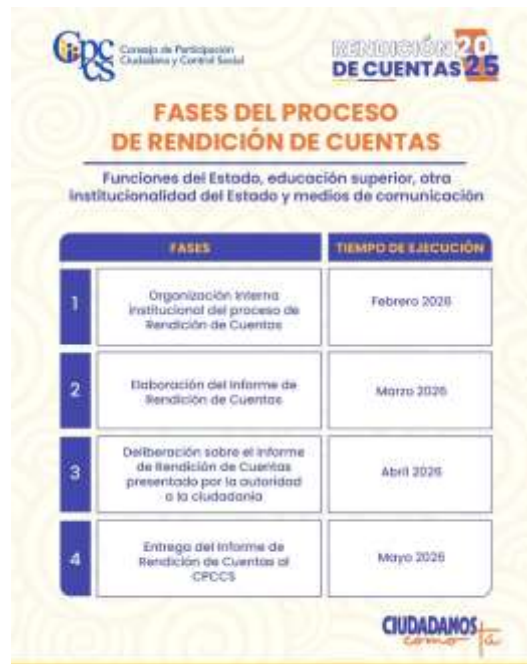
Ilustración 1 Cronograma de Fases CPCCS