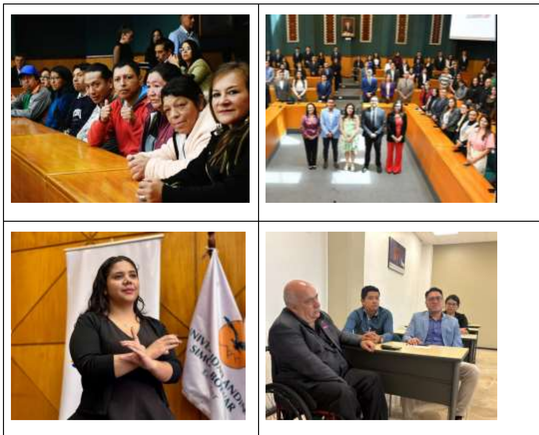
Tabla 2 Evidencia Fotográfica